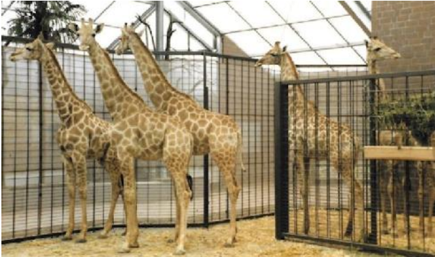
Angola-Giraffen im Zoo Dortmund 1986.