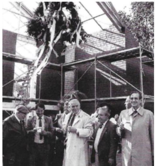
Richtfest am 03.09.1986.