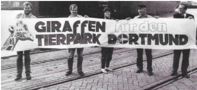
Am 16. Oktober 1986 wurden die Angola-Giraffen in Dortmund willkommen geheißen.